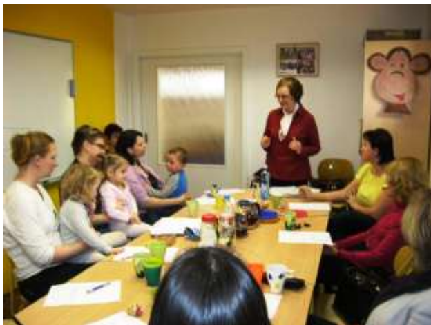
přednáška finanční gramotnost